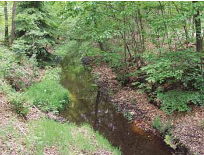
Zuidelijke Horsthoekerbeek.

Wie over de Heerderweg van Epe naar Heerde rijdt, ziet bij de Adelaarsweg een groot bord aan de linkerkant van de weg waarop luxe landhuizen te koop worden aangeboden. Niets wijst meer op de aanwezigheid van papiermolen Norel, later het wasserijbedrijf 'de Adelaar', die hier heeft gestaan aan de Zuidelijke Horsthoekerbeek. Deze beek wordt soms Molenbeek genoemd. Papiermolen Norel is de bovenste molen aan deze beek. De Zuidelijke Horsthoekerbeek is nu ter plaatse een vrij miezerig stromend watertje. Het is moeilijk voor te stellen dat er vroeger zoveel water heeft gestroomd dat een waterrad in beweging gebracht kon worden. Vrij recent is het wasserijgebouw afgebroken. Hiermee is een stukje cultuurhistorie in de gemeente Epe verdwenen. In dit artikel zal ik ingaan op de geschiedenis van de papiermolen in Norel.** Eerst ga ik iets vertellen over de Zuidelijke Horsthoekerbeek.