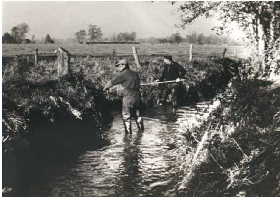
Eigen beekruimers in de Smallertse Beek.

Overigens zijn de eerste jaren na de instelling van het Waterschap Oost-Veluwe op verzoek nog een aantal onderhoudsprojecten door de Bekenstichting uitgevoerd. Het Waterschap is namelijk niet in staat om direct invulling aan de nieuwe taak te geven. Pas in 1989 wordt gestart met het programma beekherstellen onderhoud . Dit programma heeft 25 jaar gelopen en is vorig jaar afgerond. Op de volgende pagina zien we hoe het mede-eigendom van de Stichting Beheer er anno 2015 uitziet.