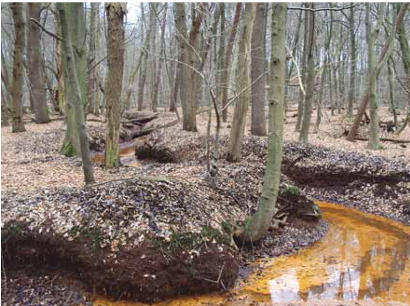
Sprengkoppen Geelmolense Beek. Foto Henri Slijkhuis.