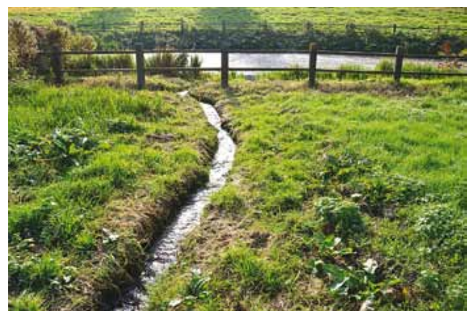
Het nieuwe beekje door het weiland bij de Molenplaats met op de achtergrond de St. Jansbeek.

Ook lang geleden niet. Maarten van Rossum had het kunnen getuigen.