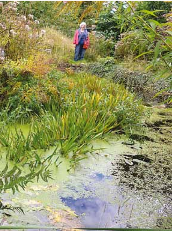
In de tuin zijn kansen geschapen voor liefst 420 soorten planten en ruim 100 diersoorten.

Daartoe behoren nogal wat planten en dieren die elders in ons land (zeer) zeldzaam zijn, maar die zich bij Sjef handhaven én voortplanten. En wat Oase ook belangrijk vindt: bezoekers, journalisten en studenten (en De Wijerd) weten de tuin te vinden. Ze kunnen er óf op afspraak terecht voor excursies óf onaangekondigd tijdens de 3 à 4 keer per maand open dagen in voorjaar, zomer en najaar. Voor verscheidene opleidingen is de tuin een leerobject. Studenten en anderen kunnen er soortenkennis opdoen, maar de tuin laat 'vooral ook zien hoe je kunt inspelen op wat de natuur zelf biedt, hoe je maatregelen neemt voor speciale plant- en diergroepen.'