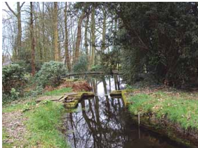
Voormalige molenplaats Molenbeek.