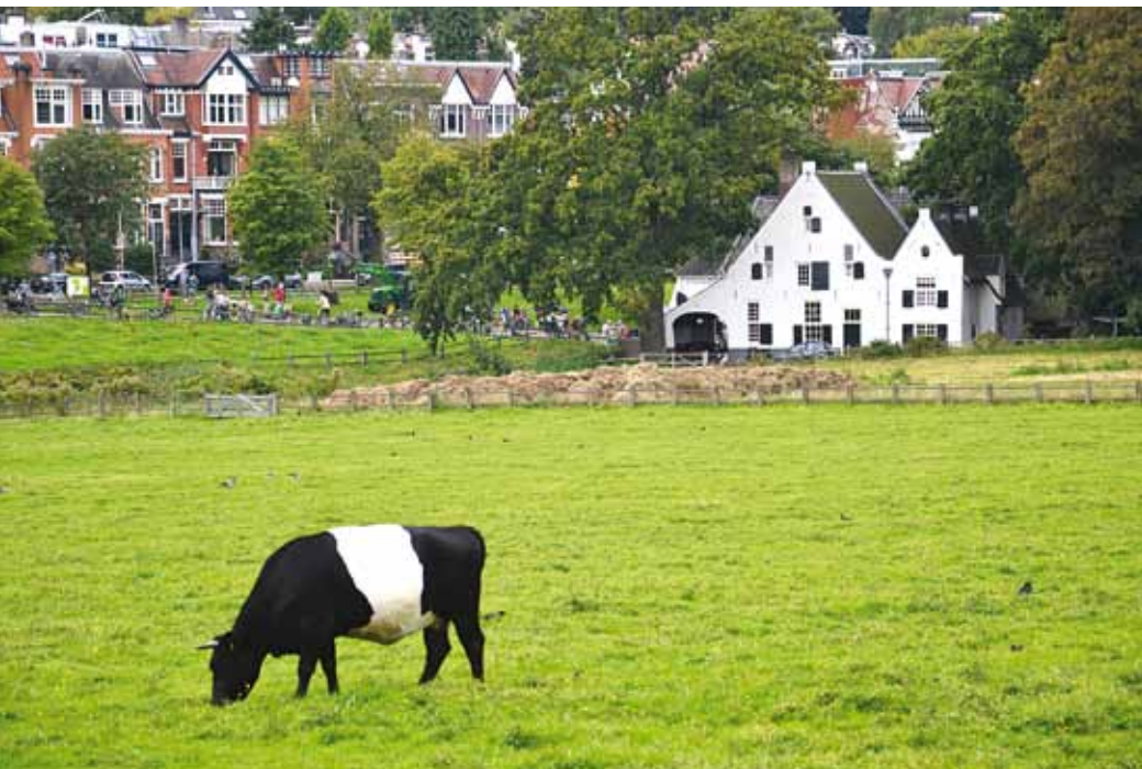
De Molenplaats met weiland in het 'dal' van de St. Jansbeek met Lakenvelders in Park Sonsbeek. Op de achtergrond de burgemeesterswijk van Arnhem.

Geen bron die het bevestigt, maar zou het niet mooi zijn als good old Maarten van Rossum er zelf heeft rondgelopen? Als deze beruchte krijgsheer, rond 1550 in dienst van de hertogen van Gelre, meermaals op de plek heeft gestaan waar nu het naar hem genoemde Lange Afstand Wandelpad (LAW 4) pal langs de Witte Watermolen en de Sint Jansbeek in het Arnhemse stadspark Sonsbeek voert? De gedachte alleen al maken de molen en de beek bijzonder.