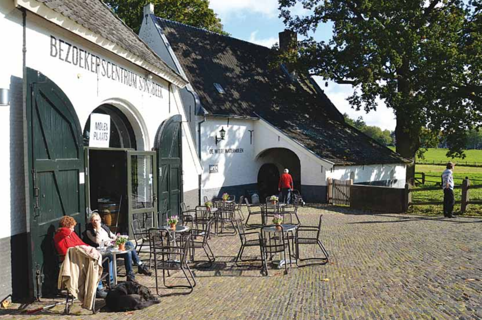
De Molenplaats in Park Sonsbeek met terras op het zuiden en uitzicht op het centrum van Arnhem.