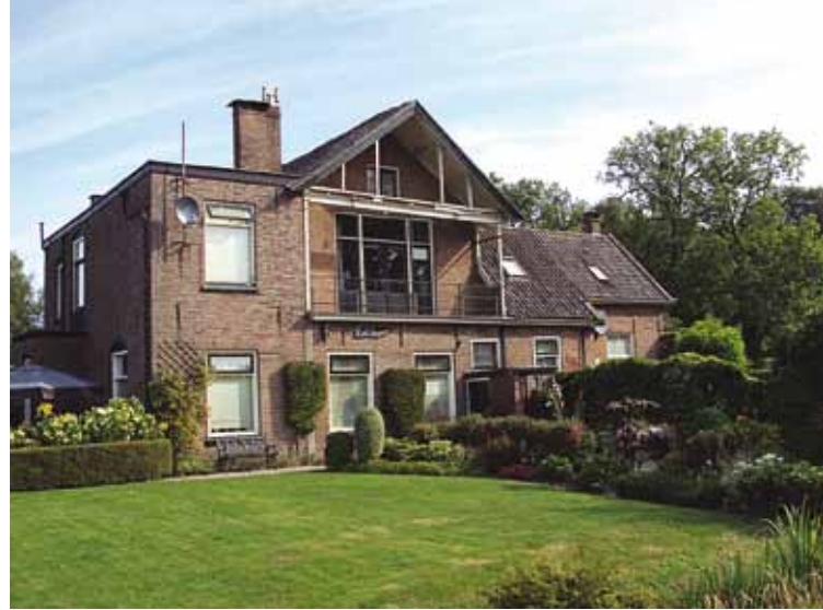
Huidige boerderij Kolthoorn.

Papiermolen De Beek is in 1675 gebouwd en heeft in zijn geschiedenis verschillende functies gehad. Aan die geschiedenis komt in 1981 een einde. Het gebouw wordt afgebroken en op de locatie wordt een villa gebouwd. Langs de waterkant wordt het oude muurwerk gehandhaafd en ook de waterval blijft bestaan. Dit is eveneens een particulier terrein dat bewoond wordt door een actief lid binnen onze stichting. In 1675 staat hier dus een gloednieuwe papiermolen, die pas in 1854 wordt veranderd in een wolmolen. In de dan gebouwde wolkammerij wordt van oude wollen lompjes nieuwe, weefbare wol gemaakt. In 1857 werken er 18 personen. Goed gaat het echter niet, want een jaar later wordt er bijna niet meer gewerkt. In 1858 wordt er opnieuw een papiermolen van gemaakt.