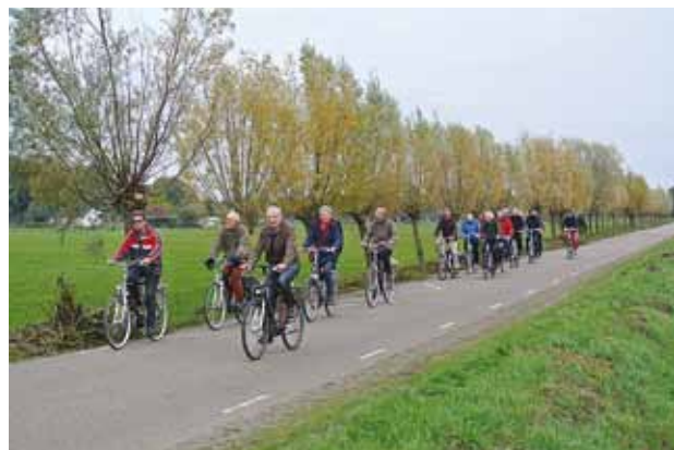
De contactpersonen maken al fietsend kennis met de Elburger beken.