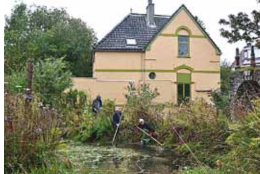
Overzicht grote vijver met woonhuis.