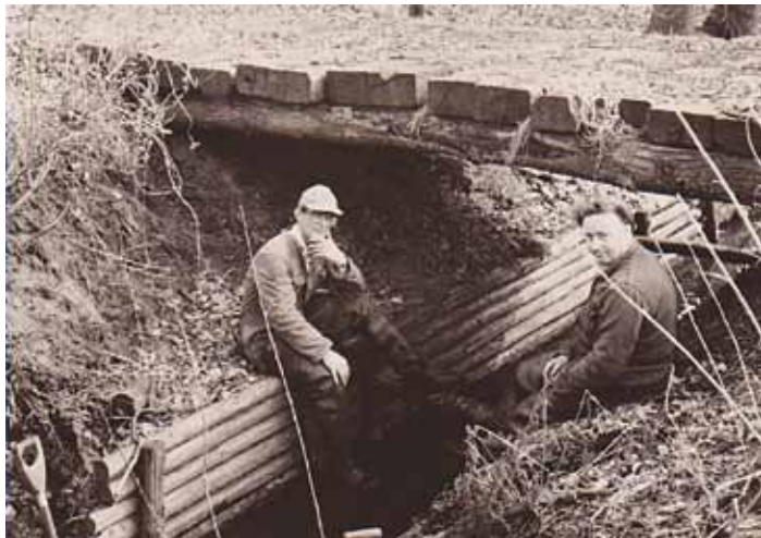
Beekruimers in de Smallertse Beek, Vaassen.