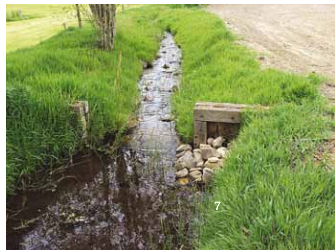
Locatie voormalig waterrad.