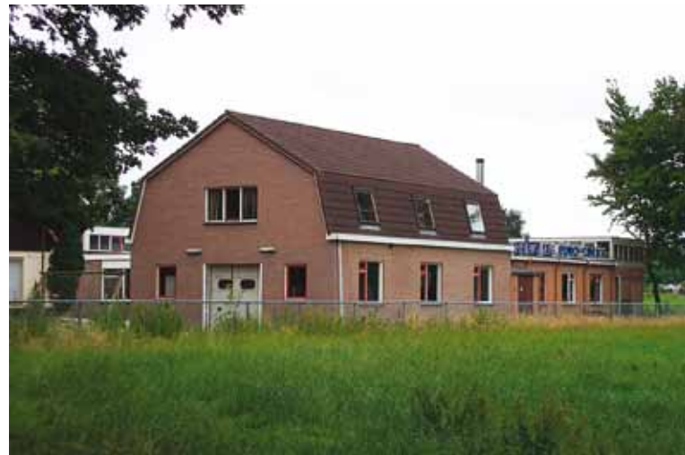
Het wasserijgebouw dat inmiddels is afgebroken.