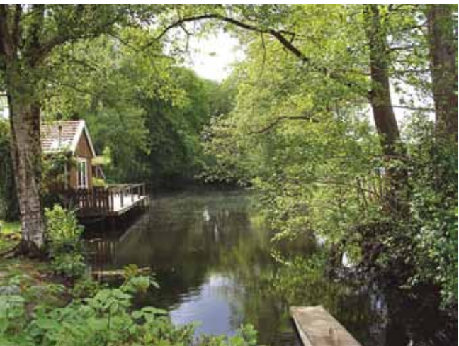
Wijerd molen van Volkers.