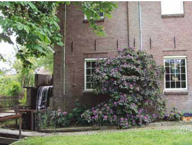
Molen van Volkers.