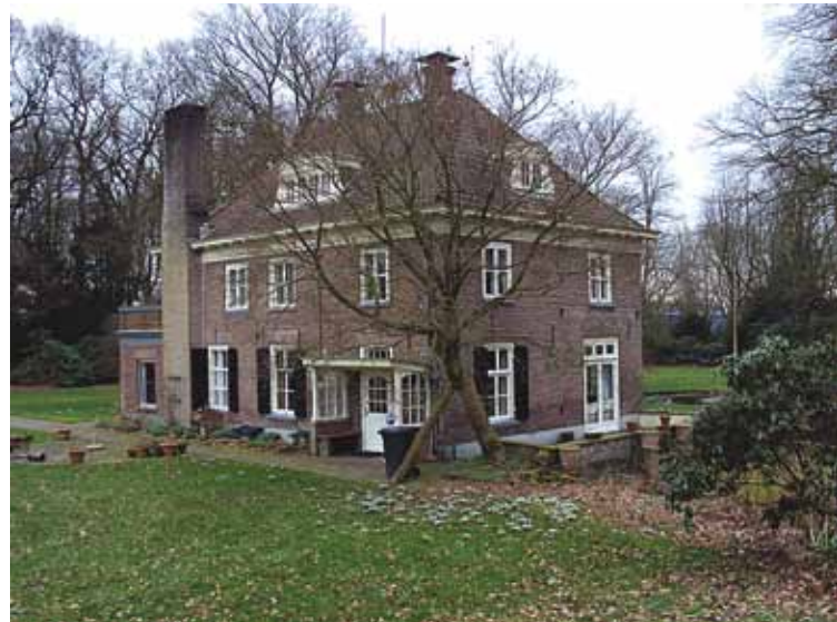
Huis Molenbeek en wijerd voormalige grutmolen.

Advertentie papiermolen de Beek.